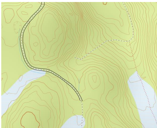
Figur 1. Traktorveger med og uten traktorvegkant

I de sammenhenger hvor det er foretatt geometriforbedring på FKB-TraktorvegSti datasettet og det ikke er rettet opp i FKB-Veg blir også resultatet misvisende for brukerne.