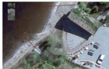
Næret til venstre har 1m feil i høide, bygging til høyre har en halv meter feil i et hjørne risset med pult, og 10 cm feil i høyden.

kontrollene er mer enhetlig leveranser og "å holde leverandørene i ørene", slik at Geovekst-partene får levert den varen som er spesifisert og betalt for.